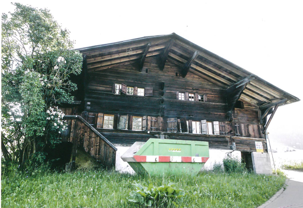
Abb. 1: Saanen-Gstaad, Litzistrasse 21. Die westliche Hauptfassade des Bauernhauses war ursprünglich schmaler. Die ehemaligen Seitenlauben sind nachträglich zu Räumen ausgebaut worden. Zur Bauzeit führten noch beidseitig Treppenaufgänge zu den Seitenlauben. Blick nach Osten.

Am südlichen Dorfrand von Gstaad direkt über dem Hang zum «Louibach» liegt ein kleines Bauernhaus. Der für das Saanenland typische Bau ist in den nach Nordosten ansteigenden Hang hineingebaut und öffnet seine Fassade nach Südwesten (Abb. 1). Bisher diente das Anwesen zwei Familien als Ferienhaus, nach dem Verkauf stehen umfangreiche Umbauten an. Im Juni 2014 bot sich dem Archäologischen Dienst des Kantons Bern dadurch die Gelegenheit, den Bestand des Hauses aufzunehmen und die Bauentwicklung nachzuvollziehen. Im Zentrum dieses Kurzberichtes steht die für das Saanenhaus des 17. Jahrhunderts charakteristische bauzeitliche Struktur.