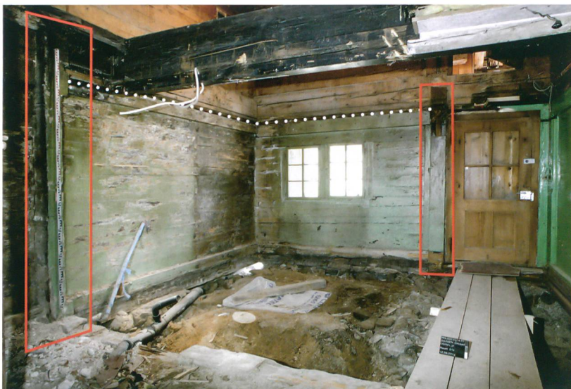
Abb. 4: Saanen-Gstaad, Litzistrasse 21. In der Südostecke befand sich einst eine Küchenstube. Ihre Ausdehnung ist anhand der Deckennut (weisse Punkte) und der beiden zurückgesägten Blockverbände (rot eingeraht) abzulesen. Blick nach Südosten.

und durch je eine Türe in der Westfassade zugänglich sind. Jüngere Veränderungen an den Maueröffnungen lassen eine im Ursprung leicht veränderte Zugangssituation mit kleineren Maueröffnungen vermuten. Ungewöhnlich ist ein Mauerversatz in der Ostwand des südlichen Kellerraums. Der Raum ist hier auf zwei Dritteln seiner Fläche um die Gangbreite des Erdgeschosses nach Osten erweitert (Abb. 2). Die Ursache dieses Versatzes bleibt vorerst offen. Ein möglicher interner Zugang über eine Falltür im Gang des Erdgeschosses scheint als Erklärung auszuschließen, da entsprechende Indizien wie Balkenlöcher oder ein Treppennegativ fehlen.