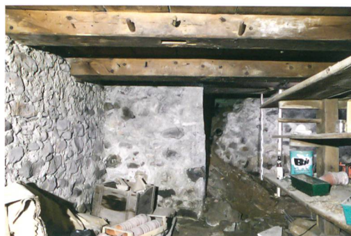
Abb. 2: Saanen-Gstaad, Litzistrasse 21. Die Ostwand im südlichen Kellerraum weist einen auffälligen Versatz auf. Auf zwei Dritteln der Länge ist sie um 1,4 m nach Osten versetzt. Der Grund hierfür bleibt unbekannt. Blick nach Osten.

Das Kellergeschoss bestand aus zwei nahezu gleich grossen Räumen, die im Bereich der Firstlinie durch eine Binnenmauer getrennt