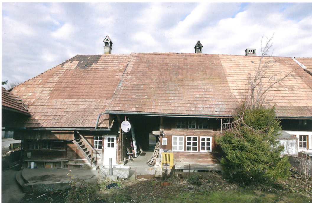
Abb. 1: Wichtrach, Oberdorfstrasse 18/20. Das Mehrfach-Taunerhaus von der Südseite. Das nachträglich angehobene Dach der östlichen Hausteile bringt die Uneinheitlichkeit des Gebäudes zum Ausdruck.

Der westliche, zur Gasse gerichtete Hausteil wurde offenbar in einem Zuge über einem