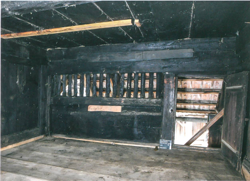
Abb. 3: Wichtrach, Oberdorfstrasse 18/20. Gadenbereich der ehemals offenen Rauchküche mit Vergitterung des Rauchabzugs im westlichen Hausteil. Blick nach Nordwesten.