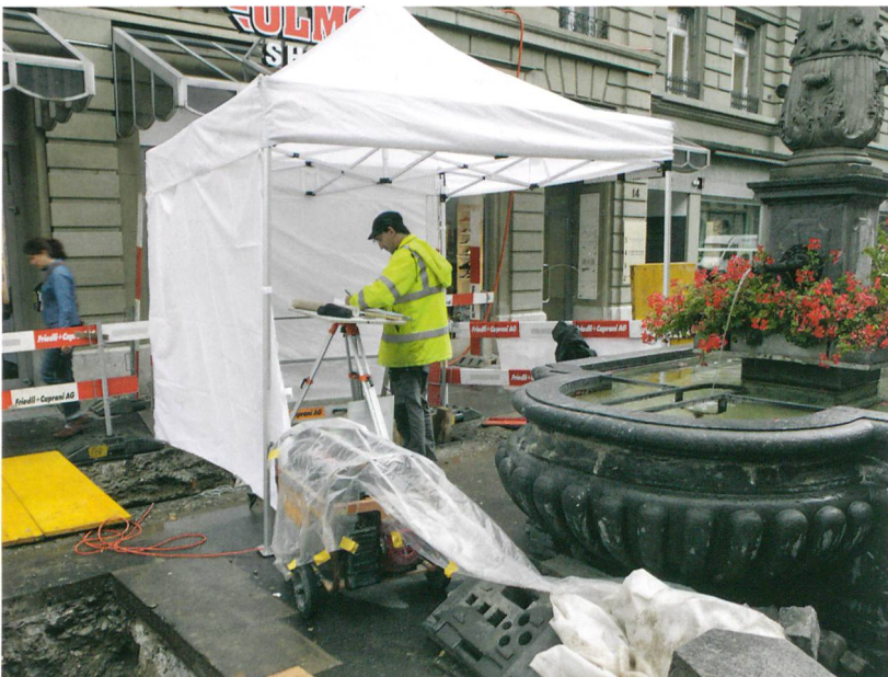
Abb. 1: Bern, Zeughausgasse. Neben dem Lindenbrunnen erfolgte der Neubau einer Trafostation. Zudem musste hier ein gassenquerender Leitungsgraben neu angelegt werden. Blick nach Nordosten.

Noch vor der Reformation wurde im Bereich des klösterlichen Baumgartens der städtische Werkhof erbaut. Aus einfacheren Holzgebäuden entstand mit der Zeit das mächtige Zeughaus, welches der Gasse ihren heutigen Namen gab. Vom 1876 abgerissenen Gebäude wurde die Nordwestecke aus Sandstein-