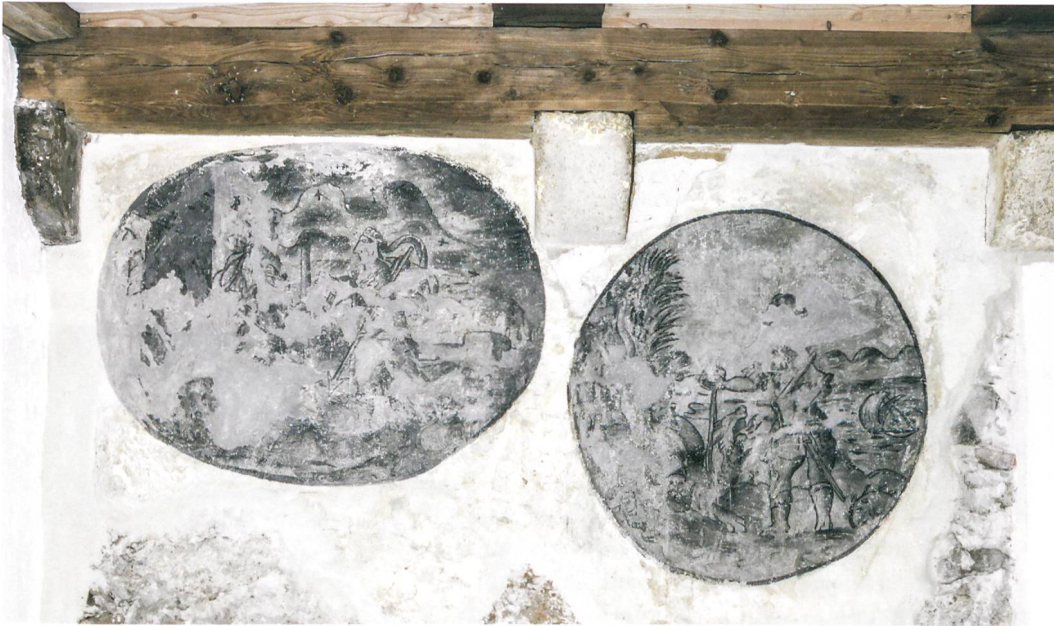
Abb. 5: Biel, Obergasse 13. Grisaille-Malerei mit der Darstellung der Geschichte von Kephalos und Prokris und Jason, der den Drachen mit Gift beträufelt aus den Metamorphosen von Ovid. Restaurierung Hans-Jörg Gerber, Nidau.