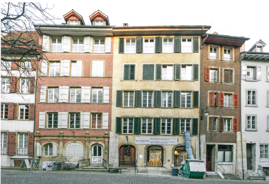
Abb. 2: Biel, Obergasse 13. Die nordwestliche Gassen- seite mit dem gelben Ge- bäude Nr. 13.

Die nordöstliche Brandmauer war geschwächt, weil sich dort ursprünglich zwei 45 cm tiefe und rund 3 m lange Wandnischen befanden, deren Füllung bei der Entfernung der Tafelung teilweise herausfiel.