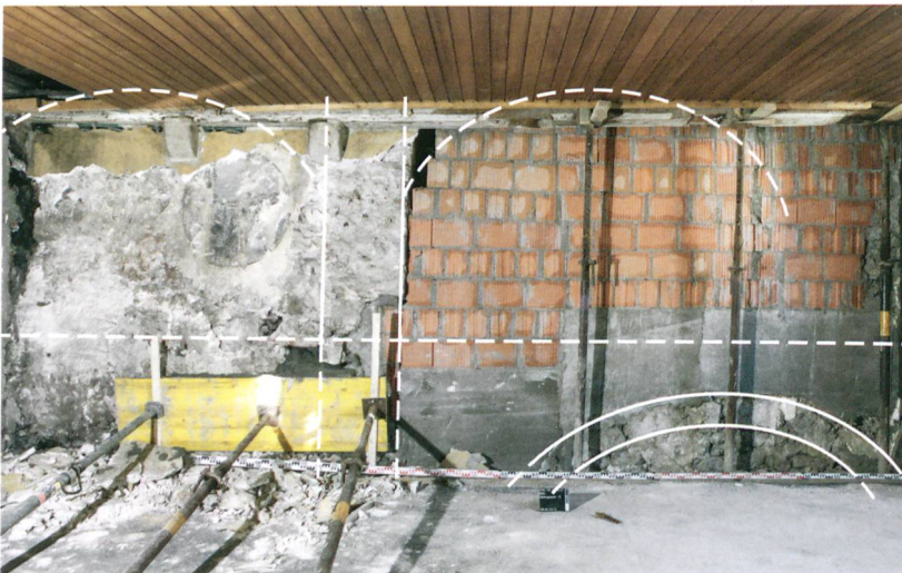
Abb. 4: Biel, Obergasse 13. Die nordöstliche Stubenwand im ersten Obergeschoss mit dem Laubenbogen, dem Wandpfeiler und den rekonstruierten Wandnischen.

dass der Hauseigentümer damals Peter Tschiffeli war. Die drei Laubenbögen beziehungsweise der Laubengang im Erdgeschoss dürften also 1577 aufgegeben und zugemauert worden sein. Das Gebäude an der Obergasse 13 wies zu dieser Zeit vermutlich nur zwei oder drei Geschosse auf. Im schmalen Nachbargebäude an der Obergasse 15 (vgl. Abb. 2, rechts von der Nr. 13) wurden vor rund 30 Jahren bei einem Umbau im Erdgeschoss ebenfalls ein Laubenbogen und im ersten Obergeschoss eine Wandnische beobachtet.