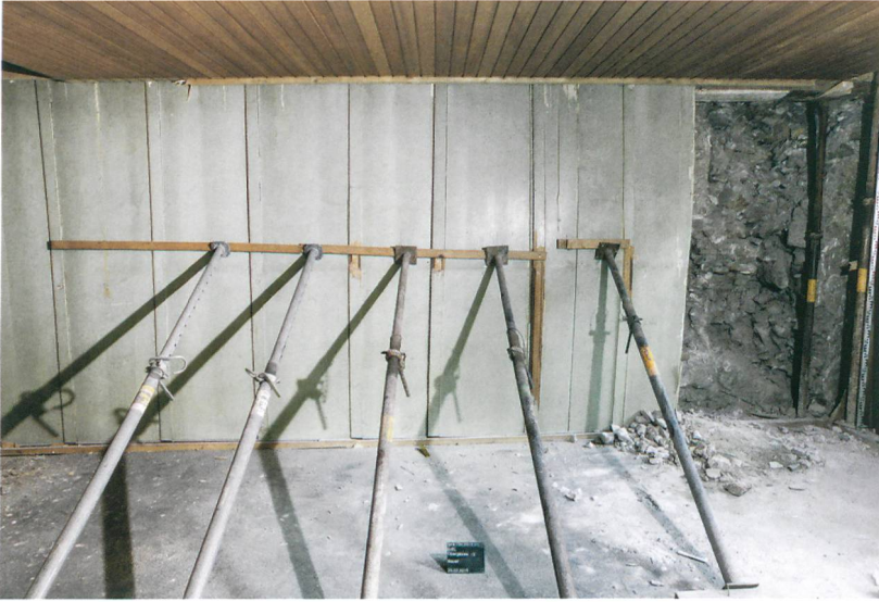
Abb. 3: Biel, Obergasse 13. Die Täferung der nordöstlichen Stubenwand im ersten Obergeschoss verhinderte das Ausbrechen der Füllung der Wandnische.

Zu den ältesten dokumentierten Baubefunden zählen im ersten Obergeschoss neben der Brandmauer mit den Wandnischen die Balkenegative der Unterzugbalken einer älteren Bodenkonstruktion und der Laubenbogen, der ursprünglich zu einem Laubengang der nordseitigen Häuser der Obergasse gehörte. Die Scheitelhöhe des Laubenbogens und die damit korrespondierenden Balkenegative zeigen, dass das Bodenniveau im ersten Obergeschoss früher rund 1,2m höher lag (Abb. 4). Anhaltspunkte für die Datierung dieses ältesten erfassten Umbaus könnte das Ratsprotokoll vom 25. März 1577 liefern. Darin wird berichtet, dass drei Hauseigentümer an der Obergasse, nämlich Hans Glatter, die [unmündigen] Kinder von Benedict Graf sel. und Peter Tschiffeli, die Erlaubnis bekommen hätten, ihre «schwibögen... Inzemuren». Viele Indizien weisen darauf hin,