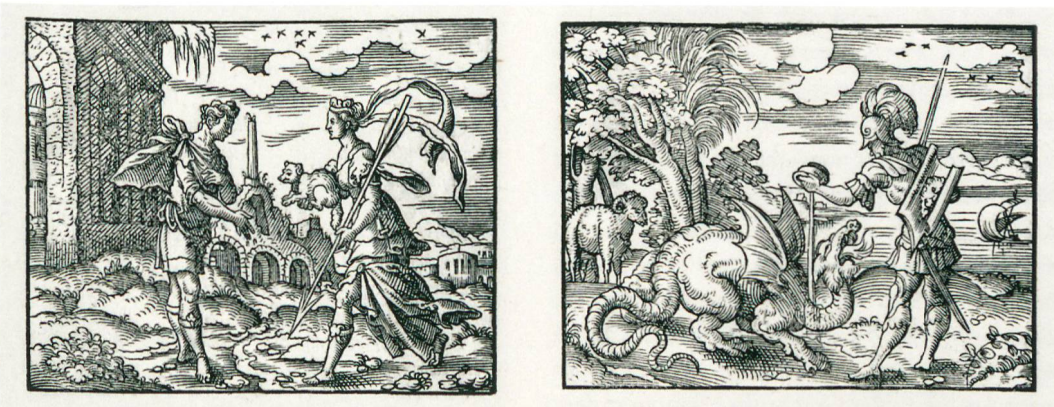
Abb. 6: Holzschnittillustrationen von Virgil Solis aus den von Johann Spreng 1562 herausgegebenen Metamorphosen von Ovid. Höchstwahrscheinlich dienten die Holzschnitte als Vorlage für die Grisaille-Malereien im Bieler Bürgerhaus.

Als Vorlage dienten dem Maler offenbar die Illustrationen der Frankfurter Ausgabe der Metamorphosen, die von Johann Spreng 1562 herausgegeben und mit Holzschnitten von Virgil Solis versehen wurde (Abb. 6).