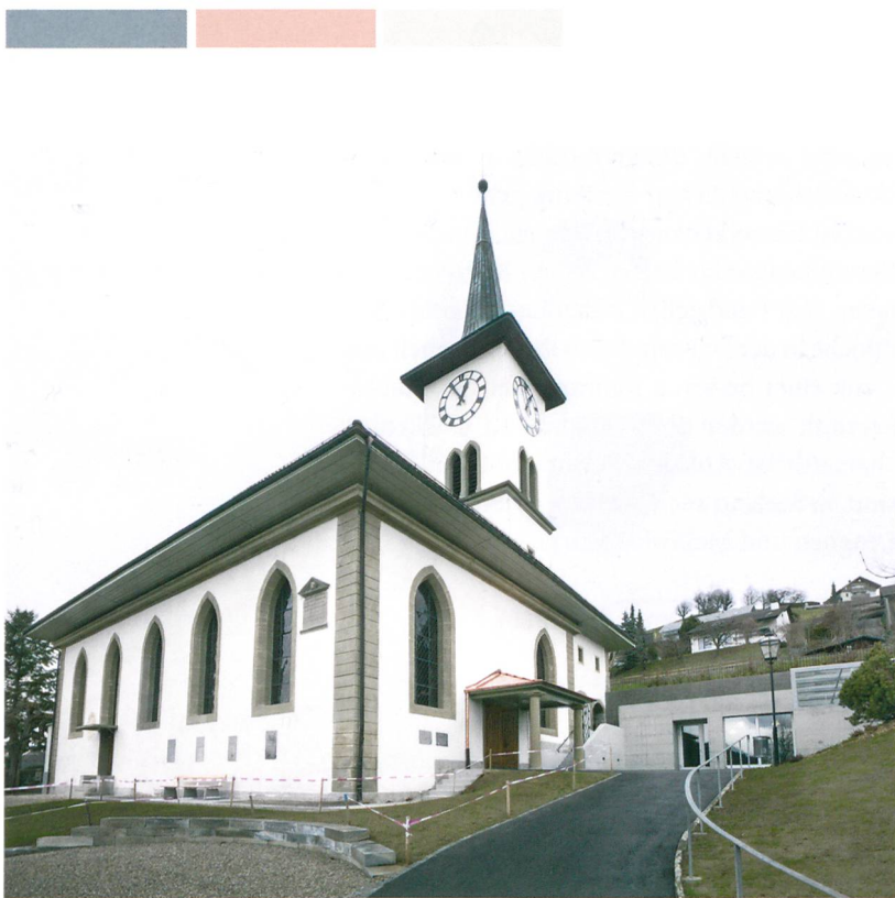
Abb. 1: Grosshöchstetten, Kirche und Friedhof. Die 1811 errichtete Kirche mit dem neuen Nebengebäude von 2015. Blick nach Nordosten.

Die Kirche von Grosshöchstetten (Abb. 1) wurde 1811 nach Plänen des Architekten Johann Daniel Osterrieth als querausgerichtete Saalkirche errichtet. Ihr heutiges Erscheinungsbild und die ungewöhnliche Ausrichtung nach Westen hat die Kirche allerdings erst beim Wiederaufbau nach dem Brand von 1882 erhalten. Zu den mittelalterlichen und frühneuzeitlichen Vorgängerbauten, die allesamt nach Osten ausgerichtet waren, ist bislang noch wenig bekannt. Während der jüngsten Restaurierungskampagne und beim Bau eines neuen Nebengebäudes auf dem Kirchhof konnte der Archäologische Dienst des Kantons Bern in den vergangenen zwei Jahren das Baudenkmal und sein Umfeld erstmals näher untersuchen und ihm dabei einige Geheimnisse entlocken.