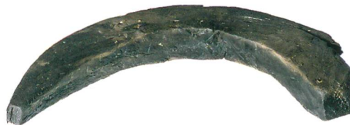
Abb. 3: Mörigen, Bucht. Dieses sichelförmige Holzartefakt mit quadratischem Querschnitt lag in der Nähe der freigespülten Konstruktionshölzer (Zone 1) auf dem Seegrund auf. M. 1:5.

Rund 100 m südlich davon konnten in einer kleinen Bucht zahlreiche Pfähle und aufstossende Schichtreste beobachtet werden (Abb. 1, Zone 3). Diese Hölzer wurden um 3140 v. Chr. geschlagen. Damit ist erstmals eine bereits seit Langem vermutete horgenzeitliche Siedlungsphase in Mörigen dendrochronologisch belegt.