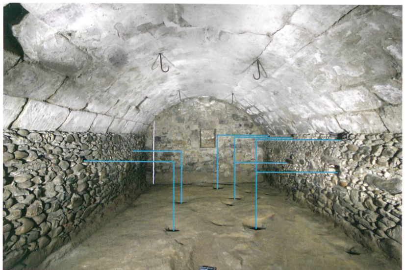
Abb. 4: Seedorf, Saumweg 3. Gewölbekeller unter dem Wohnteil um 1800. Eisenhaken, Balken- und Pfostenlöcher im Keller stammen von den ehemaligen Lagereinrichtungen. Blick nach Süden.

Abb. 3: Seedorf, Saumweg 3. Oberer Teil der alten Rauchküche. Erkennbar ist die starke Russverkrustung der Wände. Der Rauch konnte zwischen dem Wandrähm und den Deckenbrettern entweichen (weisser Pfeil). Anfang des 20. Jahrhunderts wurde der Schornstein eingebaut. Blick nach Osten.