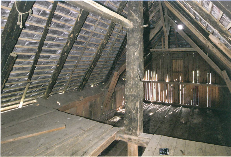
Abb. 5: Seedorf, Saumweg 3. Hinter dem rauchgeschwärzten Firstständer und dem zugehörigen Dachwerk von 1608/09 erkennt man den liegenden Dachstuhl des Ökonomieteils aus der Zeit um 1900. Blick nach Südwesten.

Mörtelmauerwerk mit Geröllsteinen und einigen Sandsteinspolien eines alten Trittofens bestehen. Über den Wänden spannt sich ein Tonnengewölbe aus fein zugehauenen Sandsteinblöcken. Sowohl in den Wänden als auch im Felsboden zeichnen sich Balken- und Pfostenlöcher einer Hurd ab. Auf der Ostseite sind darüber zwei rechteckige Belüftungsschächte ausgespart. In der südlichen Schmalseite befinden sich eine grosse Lichtnische und darüber ein weiterer Luftschacht. In die im Gewölbe befestigten Eisenhaken konnten Holzstangen eingelegt werden, um daran Vorratsgut geschützt vor Mäusefrass aufzuhängen.