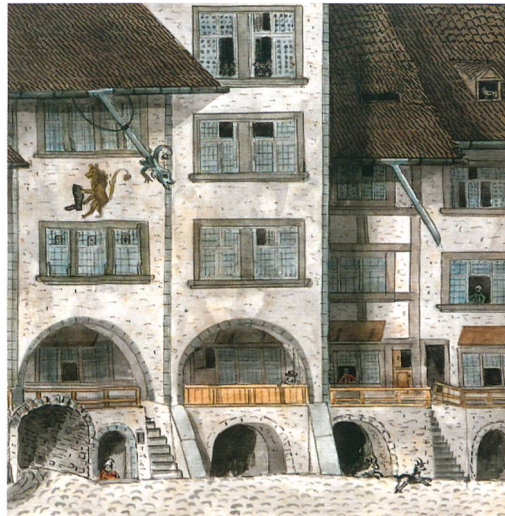
Abb. 5: Oberst Johannes Knechtenhofer zeichnete in den ersten Jahren des 19. Jahrhunderts die Häusergruppe, wie sie sich vor den Modernisierungen präsentierte. Ganz rechts Haus Nr. 28 mit der Gassentreppe, welche auch das Wohngeschoss von Nachbarhaus Nr. 30 erschloss. Das links folgende Häuserpaar Nr. 32 und Nr. 34 war noch im Besitz der alten Hochlauben.

Aus heutiger Sicht stellte sich das Vorrücken der Fassade vom Haus Nr. 30 als glückliche Fügung heraus. Als nämlich im Ladengeschoss 1907 der Einbau der exquisiten Ladenfront erfolgte, brach man das alte Tonnengewölbe nur unvollständig ab, sodass sich sein Rest bis heute erhalten konnte. Womöglich stand die vorgerückte Fassade des frühen 19. Jahrhunderts auf dem Gewölbe und hatte mittlerweile statische Schäden verursacht. Jetzt wurden die Lastlinien über eine stabile Konstruktion aus Backsteinpfeilern und Stahlträgern gebündelt und sauber auf tief gegründete Fundamente abgeleitet. Diese Massnahme dürfte den Kellerhals und das ältere Fussbodenniveau zerstört haben. Ein Mauerdurchbruch (27) mit einem neuen, höher gelegenen Durchgang (26) verband nun den Keller mit dem Gassengeschoss. Der Boden wurde mit einer Aufschüttung (2) angehoben.