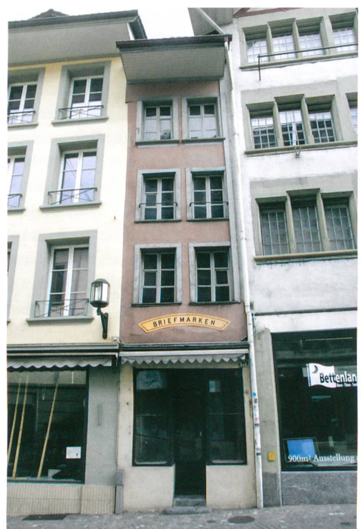
Abb. 2: Thun, Obere Hauptgasse 75. Fassadenansicht mit Blick nach Norden. Das Erdgeschoss wurde 1910 mit einer Schaufensterfront versehen. Die übrige Fassade zeigt die Gliederung aus der Zeit des sogenannten Rüfenacht-Hauses vor 1780, rechts das sogenannte Tschagggeny-Haus. Aufnahme von 2014.

Den hinteren Hausteil schliesst eine Bruchsteinmauer ab. Sie verlief einst weiter ostwärts und reichte bis ins heutige Nachbargrundstück Nr. 77 hinein. Die Mauer gehörte zum rückwärtigen Teil des ältesten Hauses (Abb. 3, Phase 1). Dort erhielt sich auch das originale Fussbodenniveau, welches über einen Meter höher als dasjenige im Vorderteil des heutigen Gebäudes lag. Zur übrigen Gestalt des ältesten Hauses fehlen verlässliche Informationen.