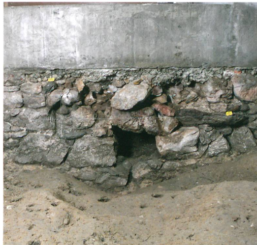
Abb. 4: Wiedlisbach, Städtli 21. Entwässerungskanal in der Stadtmauer des 13. Jahrhunderts auf Höhe des Stadtgründungshorizontes.