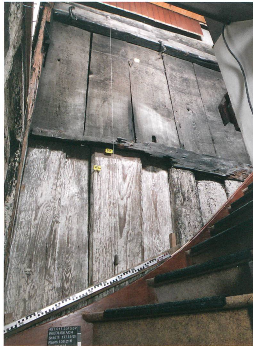
Abb. 7: Wiedlisbach, Städtli 19. Bohlenwand im ersten und zweiten Obergeschoss. Im Spätmittelalter war die Wand zwischen dem Wohnbau und dem zugehörigen Tenn eingebaut worden.

Im Gebäude Städtli 21, das seit etwa 1540 in den Quellen als «Bürger- und Rathaus» fassbar ist, lassen sich im ausgehenden 17. Jahrhundert weitere Umbaumasnahmen feststellen. Auf der Gassenseite wurde damals das Dach angehoben (Abb. 6, grün). Auch die jetzige Fenstergliederung der Fassade stammt aus dieser Zeit. Raumeinteilungen im zweiten Obergeschoss und der Einbau einer fischgratförmig verlegten Schieb- bodendecke im ersten Obergeschoss deuten auf eine umfassende Modernisierung auch im Inneren hin. Ein Dendrodatum der Decke weist in die Zeit um 1690. Weitere Anpassungen am Gebäude erfolgten im 18. und 19. Jahrhundert. Die auffälligste Massnahme wurde 1739 realisiert, als gassenseitig der heutige Quergiebel (Abb. 6, orange) eingebaut wurde. Dadurch sollte das neu montierte Uhrwerk zur Geltung gebracht werden. Der Neubau verursachte im Dachwerk allerdings erheblichen Schaden an der Statik. Anpassungen der Deckenhöhen und der Raumgliederungen des Gebäudes verschärften die prekäre Bausituation im Bereich des Dachreiters weiter. Im 19. Jahrhundert musste deshalb eine massive Unterfangung (Abb. 6, dunkelblau) eingebaut werden. Insbesondere im Erdgeschoss folgten im 20. Jahrhundert weitere Anpassungs- und Modernisierungsmassnah-