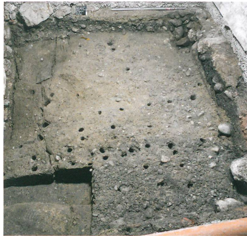
Abb. 3: Wiedlisbach, Städtli 21. Stadtgründungshorizont mit der ersten Kiesplanierung auf dem anstehenden Boden, darin die Löcher der Stickelreihe einer möglichen ersten Parzellengliederung.

Neben den Fachwerk- und Pfostengebäuden aus Holz bestanden wahrscheinlich von Beginn an auch erste Steinhäuser. Eines davon hat sich in der Brandwand zwischen den Parzellen 19 und 21 erhalten. Ausserdem zeichnen sich dort die Balkenspuren (Abb. 5, rosa) einer gassenseitigen Stube oder Kammer ab, die mit einem Holztäfer ausgeschlagen war. Deutliche