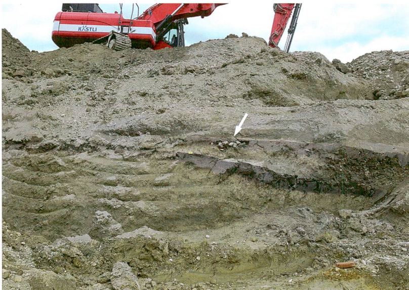
Abb. 7: Thun, Im Schoren 20. Der graue Siedlungshorizont aus der benachbarten Parzelle «Im Schoren 10» setzte sich bis in dieses Baufeld fort, aber Funde und Strukturen konzentrierten sich auf eine kleine Fläche. Die erste Grube zeichnete sich als Konzentration hitzegesprengter Steine und Holzkohle ab (Pfeil). Blick nach Nordosten.

wie in Einigen liegen. Vom Seebecken am Ausfluss des Sees fehlten aber Hinweise auf Siedlungen. Dies änderte sich mit dem Nachweis einer bronze- und hallstattzeitlichen Nutzung des Thuner Schlossberges und der Entdeckung der Fundstelle vor der Schadau 2014. Mit den neuen, hier vorgestellten Siedlungen verdichtet sich das Bild der Nutzung des Seebeckens weiter. Bestattungen, deren Grabbeigaben in die gleiche Zeit gehören wie das ältere Dorf im Schoren und vielleicht die ältere Phase in der Schadau, wurden 1946 im 1,8 km entfer-