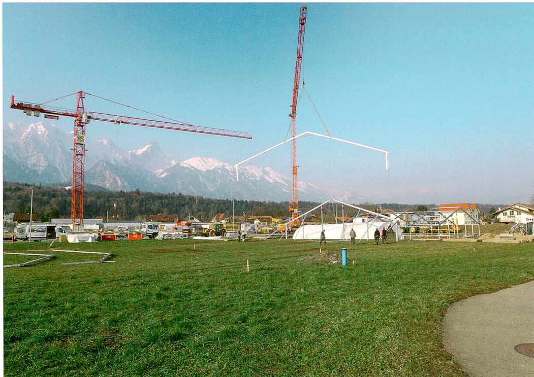
Abb. 1: Thun, Im Schoren 10. Nachdem die erste Teilfläche ausgegraben wurde, wird das Zelt umgestellt, damit auch bei winterlicher Witterung gearbeitet werden kann. Blick nach Osten.

REGULA GUBLER, MARCO AMSTUTZ UND LEONARDO STÄHELI