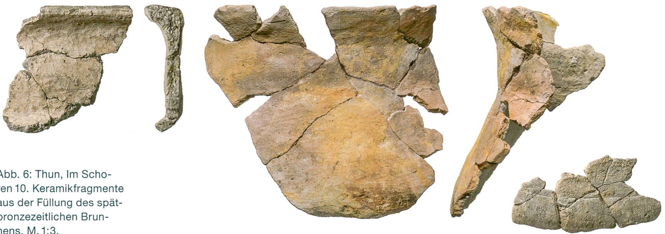
Abb. 6: Thun, Im Schoren 10. Keramikfragmente aus der Füllung des spätbronzezeitlichen Brun- nens. M. 1:3.

Abb. 7: Thun, Im Schoren 20. Der graue Siedlungshorizont aus der benachbarten Parzelle «Im Schoren 10» setzte sich bis in dieses Baufeld fort, aber Funde und Strukturen konzentrierten sich auf eine kleine Fläche. Die erste Grube zeichnete sich als Konzentration hitzegesprengter Steine und Holzkohle ab (Pfeil). Blick nach Nordosten.