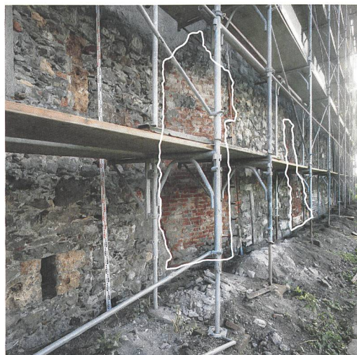
Abb. 3 (rechts): Spiez, Neues Schloss. Rot eingefärbt ist die gut 1,9 cm mächtige Ringmauer. Sie ist mit der abgehenden Umfassungsmauer klar im Verband. Blick nach Süden.

Abb. 1 (links): Spiez, Neues Schloss. Ansicht der 1988 freigelegten Südfassade des Neuen Schlosses. Grau eingefärbt sind die Mauerausbrüche, welche mit Vollbacksteinen verschlossen wurden. Blick nach Südosten.