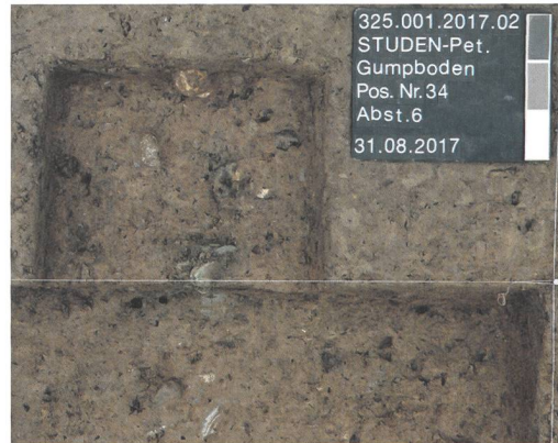
Abb. 3: Studen, Gumpboden. Fläche 1. Detailaufnahme des Münzdepots.

Die Ausgrabung in Tempel 1 wurde mittels LiveCam ins Neue Museum Biel übertragen. Somit konnte man dort während der Sonderausstellung «Petinesca – Aus dem Innern eines Hügels» die Studierenden beim Ausgraben und Dokumentieren beobachten. Die neusten Ausgrabungen sind also – wie bereits diejenigen vor 80 Jahren – mit bewegten Bildern dokumentiert und entsprechend als Zeitdokument für den Sommer 2017 abgelegt.