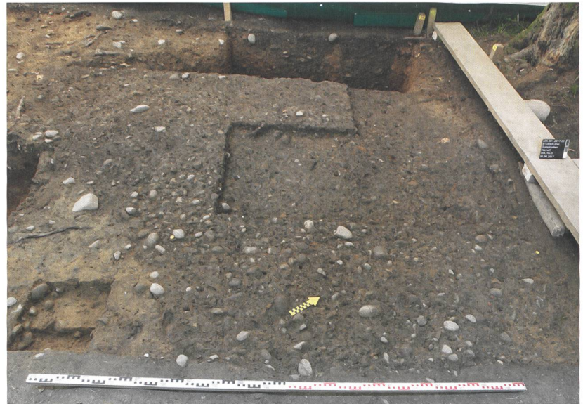
Abb. 4: Studen, Gumpboden. Fläche 2. Die rechtwinklige Struktur wurde im Profil (links) angeschnitten, rechts davon der Sondiergraben von 1937/38.