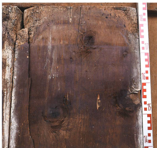
Fig. 8 : La Neuveville, rue du Collège 5. Madrier découvert en remploi dans le sol de la cuisine du 1 er étage. Daté de 1507 par la dendrochronologie, il appartenait au plafond-plancher du 2 e étage.

appliqué un décor peint de filets noirs, ocres et gris-bleu, dont il ne subsistait que quelques traces. Un décor similaire fut observé sur le plafond lambrissé de la pièce 16 décrite plus haut.