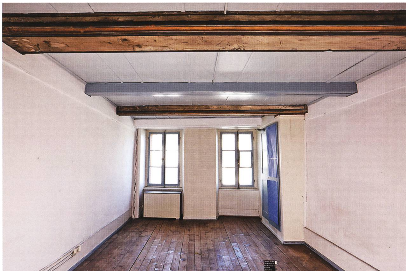
Fig. 6 : La Neuveville, rue du Collège 5. Les solives du plafond de la pièce 16, au 2 e étage, étaient moulurées et se rapportaient à une phase de transformation ou de rehaussement du bâtiment datée de 1507. Le plafond fut renforcé ultérieurement par des solives supplémentaires. Vue vers l'est.