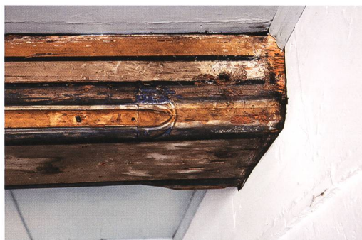
Fig. 7 : La Neuveville, rue du Collège 5. Détail de la tête de la solive médiane datée de 1506/07. Le solivage et le plafond furent peints ultérieurement, probablement au 18 e siècle.