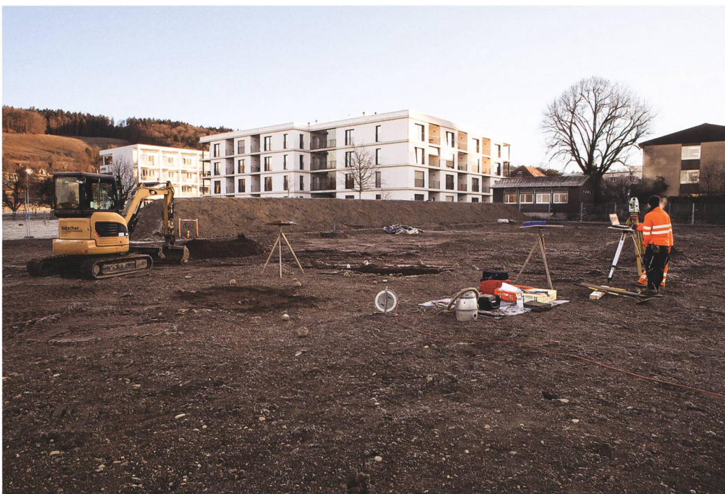
Abb. 1: Muri b. Bern, Allmendingenweg 3, 3a, 3b. Bei der Rettungsgrabung wurden nach Abtrag der oberen Bodenschichten auffällige Strukturen kleinflächig freigelegt, eingemessen und dokumentiert, bevor sie zur weiteren Untersuchung und Fundbergung mit dem Bagger geschnitten wurden. Blick nach Nordosten.

Im Grossteil der Fläche kam unter dem modernen Humus eine Deckschicht und darunter direkt verwittertes Material der Moräne zum Vorschein. In der Mitte der untersuchten Zone war zusätzlich ein alter Humus erhalten geblieben, welcher auch in den Untersuchungen von 2013 (s. u.) erkannt worden war. Dieser lag zwischen Deckschicht und verwitterter Moräne und bildete vermutlich ehemals die natürliche Oberfläche. Weiter wurden zahlreiche, verschieden grosse Gruben dokumentiert (Abb. 2). Die meisten reichten in ihrer Tiefe in das verwitterte Moränenmaterial, das sich von der darunterliegenden Grundmoräne abhob, und wurden von der verwitterten Deckschicht überdeckt. Einzig Grube 53 lag unter dem verwitterten Moränen-