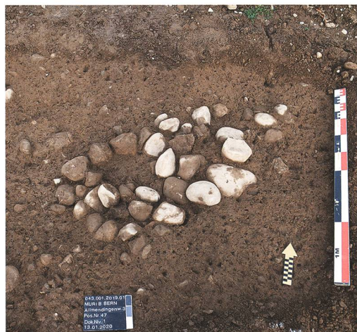
Abb. 3: Muri b. Bern, Allmendingenweg 3, 3a, 3b. An der Oberfläche (links) setzt sich die Pfostengrube 47 mit einer Konzentration von Steinen deutlich vom Untergrund ab. Im Schnitt (rechts) ist erkennbar, dass der heute verrottete Holzpfosten in der 0,84 m tiefen Grube mit einer dichten Steinpackung verkeilt wurde. Blick nach Norden.

Die verschiedenen Gruben enthielten nur wenig Fundmaterial, häufig grob gemagerte, handgeformte Keramikscherben und Holzkohlefragmente. Die Holzkohlen datieren gemäss Radiokarbon datierung in die Jungsteinzeit, die Mittel- und beginnende Spätbronzezeit sowie in die frühe Eisenzeit (Abb. 4). Was die Proben datieren, ist nicht klar, denn aus derselben Grubenverfüllung liegen verschieden alte Daten vor. Wie viel vorher wurden die Gruben ausgehoben, wie lange wurden sie genutzt und