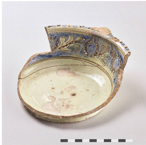
Abb. 1: Zweisimmen, Schloss Blankenburg. Schüssel mit ausladendem Rand und Griffklappen. Ansicht von der Seite (a) und von unten (b). M. 1:3.

Schloss Blankenburg in der Gemeinde Zweisimmen ist seit 1383 eines der Landvogteischlösser des Alten Bern. Es tritt uns als barockes Gebäude entgegen, das in den Jahren 1768 bis 1770 errichtet wurde. Seit 2011 befindet es sich im Besitz der Stiftung Schloss Blankenburg. Wie die mittelalterliche Vorgängerborg aussah, ist unbekannt, da diese 1767 abbrannte. Bei Sanierungsarbeiten an der Aussenseite der Umfassungsmauer der nördlich des Schlosses liegenden Zufahrt wurden im Juni 2019 Scherben