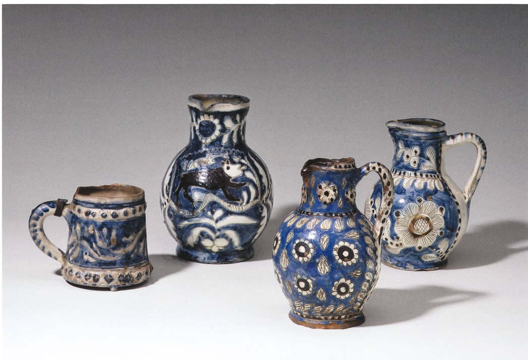
Abb. 3: Irdenware mit Ritz- und Unterglasur-Pinseldecor aus dem Bernischen Historischen Museum, Mitte des 18. Jahrhunderts. Von links nach rechts Inv.-Nrn. H21534, H7171, H6058 und H15114.