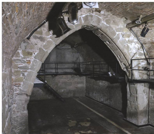
1 Bern, Kramgasse 4. Der Gurtbogen von Süden. Die ungleichmässig breiten Fugen geben bereits einen Hinweis darauf, dass der Bogen nicht original an dieser Stelle sitzt, sondern wiederverwendet und ohne grosse Sorgfalt aufgemauert wurde.

Das älteste nachweisbare Mauerwerk (2; erste Phase, rot) war im Südteil der Ostwand zu fassen (Abb. 4). Es endet im Norden an einem Wundverband, der entstanden war, als die im Verband stehende Nordmauer (6) abgebrochen wurde. Weitere zugehörige Mauern fehlen ebenso wie Öffnungen oder Hinweise auf einen Boden und eine Decke. Es lässt sich ein rund 7 m tiefer Keller von unbekannter Breite rekonstruieren. Das Mauerwerk besteht aus gleichmässig behauenen und lagig vermörtelten Sandsteinquadern und enthält an einigen