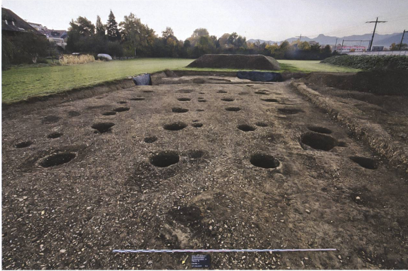
6 Münsingen, Entlastungsstrasse Nord. Auffällig grosse Pfostengruben in mehreren Reihen. Sie gehören zu einem vermutlich römischen Holzgebäude. Blick nach Süden.

Sohle liegender grossfragmentierter Keramikscherben ebenfalls in die späte Latènezeit zu datieren. Dies bestätigt eine Radiokarbondatierung. Der nördliche Graben (Pos. 624) war lediglich 1,2 m breit und lieferte kaum Funde aus den unteren Auffüllungen, die jüngste enthielt bereits römische Dachziegel. Aufgrund seiner Lage und Orientierung dürfte er in der Spätlatènezeit ausgehoben worden sein. Holzkohleproben aus den Auffüllungen werden eine genauere Datierung erlauben.