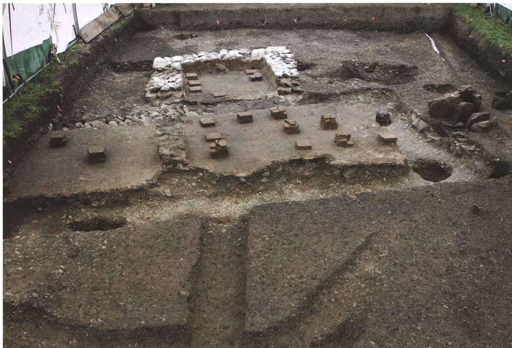
8 Münsingen, Entlastungsstrasse Nord. Die hypokaustierten Räume des Badetrakts mit südlich angebautem Warmwasserbecken. Die Hypokaustpfeiler waren dort enger gesetzt, um das Gewicht des Wassers zu tragen. Rechts die Einfeuerung (Präfurium) der Bodenheizung. Blick nach Süden.

Im 2020/21 untersuchten Steingebäude deuten Reste eines kaum 0,2 m breiten, aus Bruchsteinen trocken gesetzten Mäuerchens, wohl ein Balkenlager, auf eine nachträgliche Unterteilung des grössten Raumes. Das Gebäude