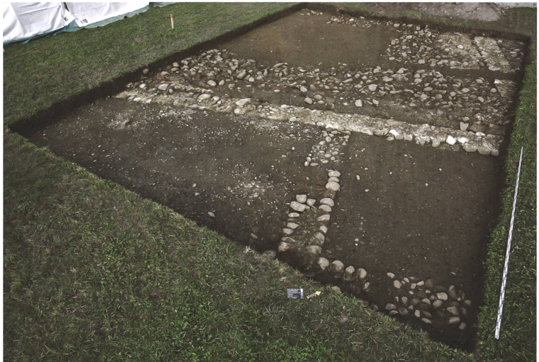
7 Münsingen, Entlastungsstrasse Nord. Direkt unter dem modernen Pflughorizont liegende Fundamente des römischen Steinbaus. Im Vordergrund zwei kleine, südseitige Räume, im Hintergrund der Südostteil des grossen Raums, verfüllt mit Abbruchschutt. Blick nach Nordwesten.

Sohle liegender grossfragmentierter Keramikscherben ebenfalls in die späte Latènezeit zu datieren. Dies bestätigt eine Radiokarbondatierung. Der nördliche Graben (Pos. 624) war lediglich 1,2 m breit und lieferte kaum Funde aus den unteren Auffüllungen, die jüngste enthielt bereits römische Dachziegel. Aufgrund seiner Lage und Orientierung dürfte er in der Spätlatènezeit ausgehoben worden sein. Holzkohleproben aus den Auffüllungen werden eine genauere Datierung erlauben.