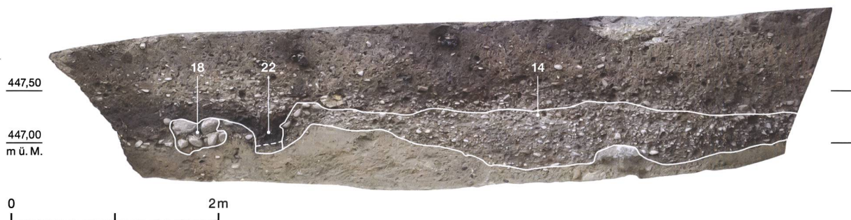
4 Studen, Rebenweg 23. Westprofil mit Strassenkoffer (14), Kanal (22), Mauer (18). M. 1:50.

der römischen Strasse dokumentiert werden (Abb. 3). Im Bereich eines geplanten Carports bestand nun die Aussicht, auf einer Fläche von 42 m 2 weitere Reste dieser Strasse zu untersuchen und abzuklären, ob dort mit römischen Gebäuderesten zu rechnen ist. Da für die Baugrube des Neubaus das Terrain 80 cm abgesenkt werden musste, entschied sich der Archäologische Dienst des Kantons Bern, die Parzelle vor Baubeginn flächig zu untersuchen.