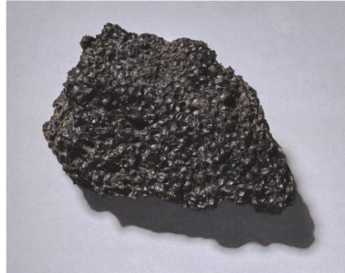
7 Studen, Rebenweg 23. Klumpen verbrannter Rispenhirse, der im Kanal gefunden wurde. M. 1:1.

Südlich des Kanals verlief eine 40 cm breite Mauer (Pos. 18; Abb. 3 und 4), die einst zu einem zwischen der Strasse und der Hangkante gelegenen Gebäude gehört haben muss. Einige gemörtelte Lagen waren nach Westen hin auf einer Länge von etwa 1,80 m sowie ostseitig nur noch fragmentarisch erhalten, im Bereich dazwischen war hingegen einzig deren Rollierung vorhanden (Abb. 5 und 6). Die schmale Mauer und die geringe Tiefe der Rollierung (knapp 30 cm) sprechen für ein Balkenlager oder ein Sockelfundament für ein Holzgebäude. Ebenso könnte die Mauer als Unterbau für eine Wand aus Lehm- und Holzfachwerk oder als Auflage für eine porticus (Säulengang) gedient haben. Da in der untersuchten Fläche von 1991 keine Gebäudereste zum Vorschein gekommen sind und der östliche Abschluss unter dem Gebäude am Rebenweg 23 liegen müsste, ergaben sich keine Anhaltspunkte für die Ausdehnung des Hauses. Weder Befund noch Funde liefern einen Hinweis darauf, welchem Gewerbe oder Zweck dieses beim östlichen Ortseingang an der Strasse gelegene Gebäude gedient hatte.