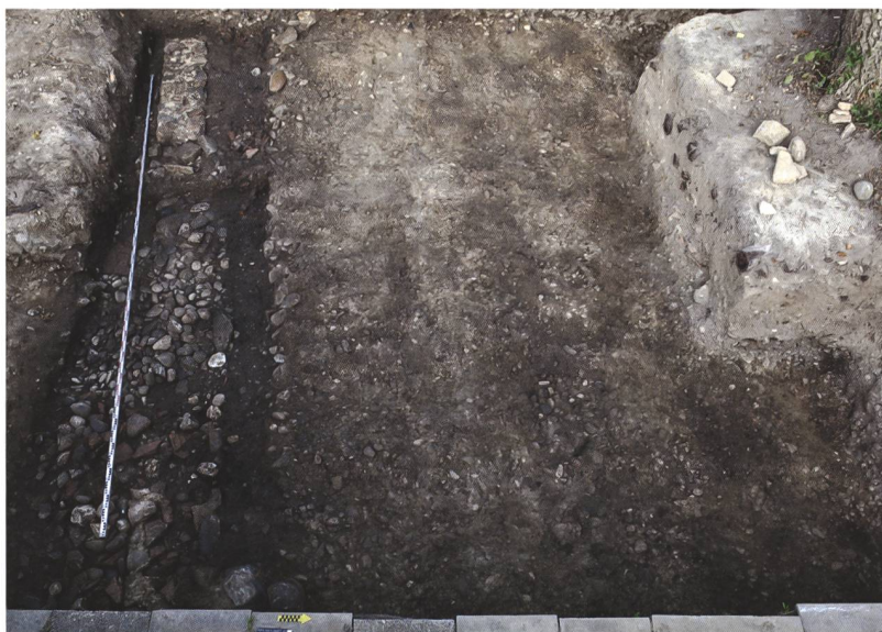
6 (rechts) Studen, Rebenweg 23. Detailsicht des Kanals rechts und der Gebäudemauer links.