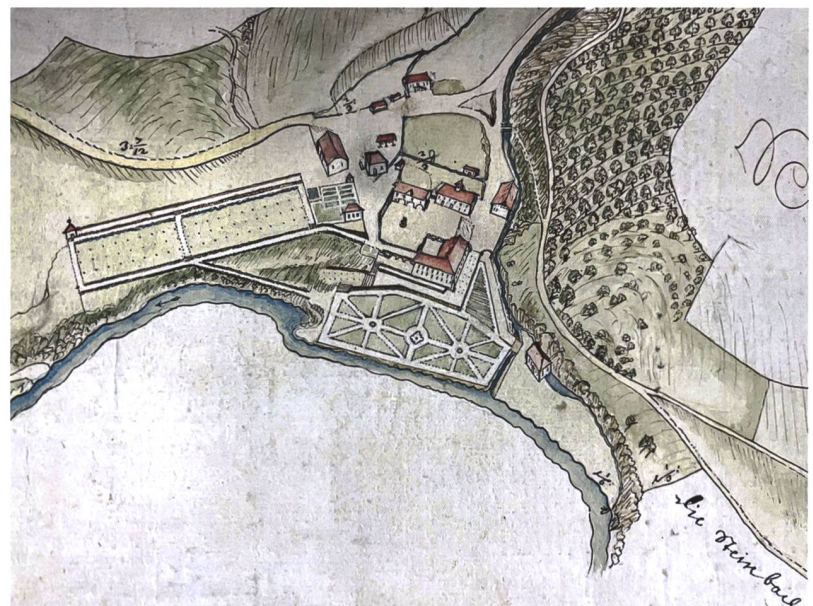
4 Zollikofen, Schloss Reichenbach. Situationsplan von 1717, vielleicht von Johann Adam Riediger.

Mit dem Nachweis, dass es sich um die alte Schlossgartenmauer handelt, ist eine wichtige Voraussetzung geschaffen worden, den terrasierten, einstmals überaus prächtigen barocken Garten des Schlosses Reichenbach (Abb. 7) in