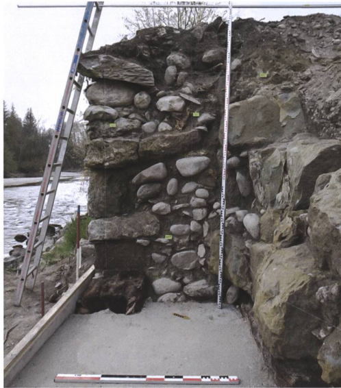
6 (rechts) Zollikofen, Schloss Reichenbach. Detail der Holzkonstruktion unter der Mauer: Armierungsschwelle mit eingeschlagenem Pfahl (Pfeil) zur Fixierung. Blick nach Norden.