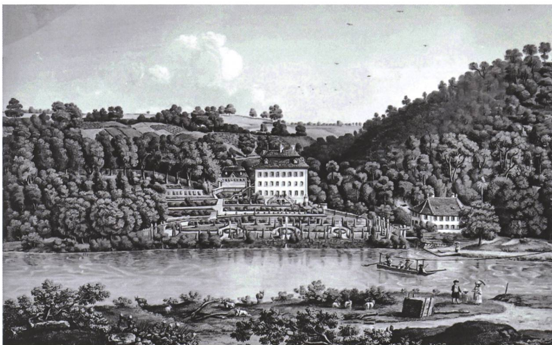
7 Zollikofen, Schloss Reichenbach. Gouache-ansicht von 1781 von Johann Niklaus Schiel. Privatbesitz.

ist nach einheitlichem Plan als Winkelanlage in einem zusammenhängenden Bauprozess erbaut worden. Es entstand zuerst der Ostflügel in seiner ganzen Länge. Für dessen liegenden Dachstuhl wurden Hölzer mit den Schlagjahren 1683 bis 1685 verwendet, für den Dachstuhl des unmittelbar folgenden kürzeren Südflügels solche, die im Winter 1686/87 gefällt wurden. Damit ist nachgewiesen, dass die eigenwillige Grundform des Schlosses einen einheitlichen Baugedanken darstellt. Beigetragen zur Wahl dieser Baugestalt hat zweifellos auch die Übernahme älterer Grundstrukturen, aber ausschlaggebend dürfte die Idee gewesen sein, vom Fluss, vom gegenüberliegenden Ufer und von der seit alters bestehenden Fähre den Eindruck einer mächtigen Anlage auf quadratischem Grundriss von 8 auf 8 Achsen zu vermitteln, die den Hofhohlraum gegen Norden nicht erkennen lässt, ein geschlossenes Volumen unter dem ersten grossen Mansarddach im Kanton Bern.