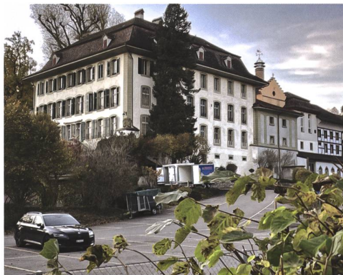
2 Zollikofen, Schloss Reichenbach. Heutiger Zustand. Blick nach Nordwesten.

Zu diesen, aus heutiger Sicht, Fehlbeurteilungen hat die seltene Form des Winkelbaus geführt, die man sich als Produkt einer einzigen Bauphase in der Barockzeit nicht recht vor-