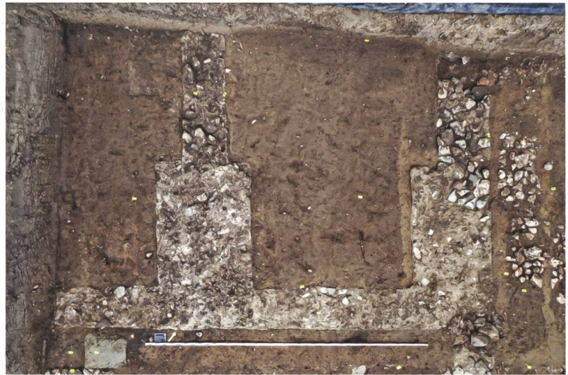
5 Ins, Riserenweg 13. Detail der Mauern des Nordgebäudes (römisch, jüngere Phase; Abb. 3, Nrn. 30 und 32) mit deutlichen Verbreiterungen der Fundamente.

Durch die Rettungsgrabung am Riserenweg 13 in Ins wurden nun die Reste eines römischen Gutshofes bestätigt. Trotzdem bleibt die Frage nach der Grösse und Ausdehnung des Gutsbetriebes sowie die ungefähre Zeit seiner Nutzung offen. Die Ausdehnung des Gutshofes lässt sich auch anhand der verschiedenen älteren Fundmeldungen nur teilweise erfassen. Da in dem Einfamilienhausquartier noch einige Flächen un bebaut und auch angrenzende landwirtschaftliche Flächen zugänglich sind, könnte diese Fundstelle mit geophysikalischen Prospektionen weiter erforscht werden. Zudem