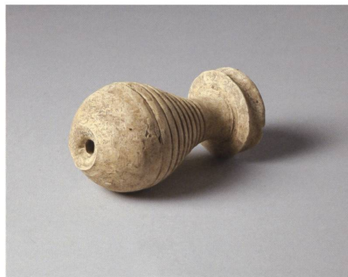
6 Ins, Riserenweg 13. In der Grube 9 konnte ein als Amphorenverschluss oder als Salbgefäss interpretiertes Tongefäss geborgen werden. M. 1:3.

wird die Begleitung kommender Um- und Neubauten den Wissensstand zu dieser einst isoliert auf einer Koppe gelegenen Gutshofanlage stetig erweitern.