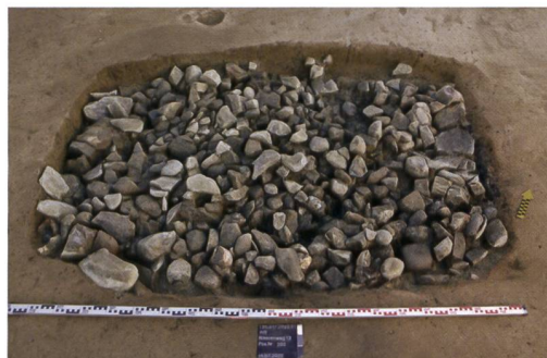
4 Ins, Riserenweg 13. Die mit Hitzesteinen gefüllte prähistorische Gargrube.

einem der Räume Reste eines Estrichs aus hydraulischem Mörtel (Pos. 250). Durch Beimengung von Ziegelbruch bekam dieser Boden wasserfeste Eigenschaften. Da er von Rollierungen umgeben war, muss es sich um einen abgetieferten Raum gehandelt haben. Zu einem späteren Zeitpunkt wurde das Gebäude zum Teil abgebaut und nach Südosten hin erweitert (Abb. 3, grün). Möglicherweise wurden gewisse Mauern der älteren Phase auch in der jüngeren beibehalten, was eine Weiternutzung des mit Mörtelboden ausgestatteten Raumes erklären könnte. Sicherlich zur jüngeren Phase gehört die südöstlichste Mauer (Pos. 58), bei der es sich um eine zur Freifläche hin geöffnete, überdachte Portikus gehandelt haben dürfte. Auffällig sind die auf einer Länge von 3 m um jeweils 30 cm verbreiterten Fundamente (Pos. 30 und 32) in den