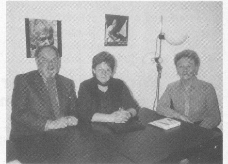
3 Vorstandsmitglieder der Grauen Panther Basel

Wer gedacht hat, die Grauen Panther seien nur bei unseren Nachbarn in Deutschland anzutreffen, ist kürzlich eines besseren belehrt worden. Pressemeldungen informierten Ende Jahr über die Gründung der Grauen Panther in Basel. AKZENT wollte die kämpferischen Senioren kennenlernen. Hier ein Kurzbericht über ein Gespräch mit drei Vorstandsmitgliedern des neu gegründeten Vereins.