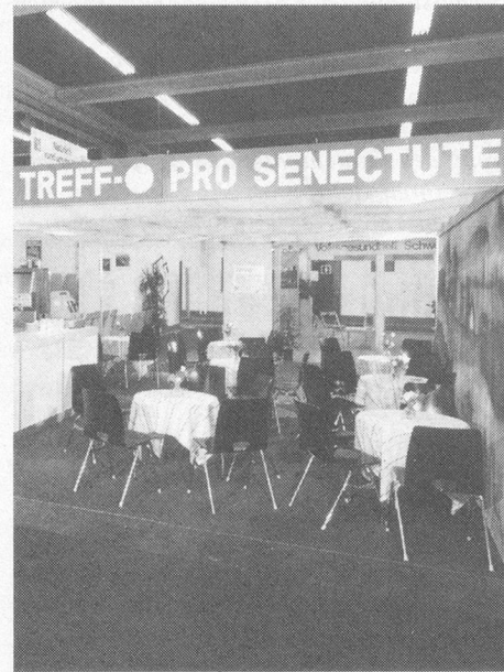
Das Pro Senectute-Kaffeli: Ruheinsel im Mubasturm

Was hat Pro Senectute Basel mit «gesundem Brot» zu tun? Auf den ersten Blick scheint die Verbindung zur Natura-Sonderschau «Gesundes Brot» ungewöhnlich. Doch abwegig ist die Beteiligung von Pro Senectute Basel nicht.