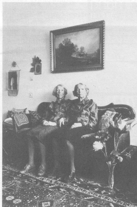
Porträts von Menschen über Achtzig