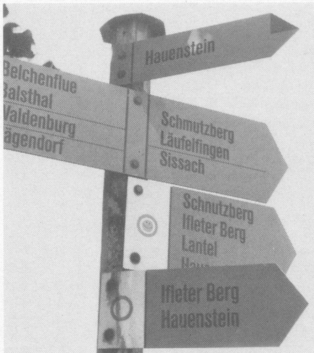
Rechts, links oder geradeaus? Unsere Wanderleiter führen Sie sicher ans Ziel.