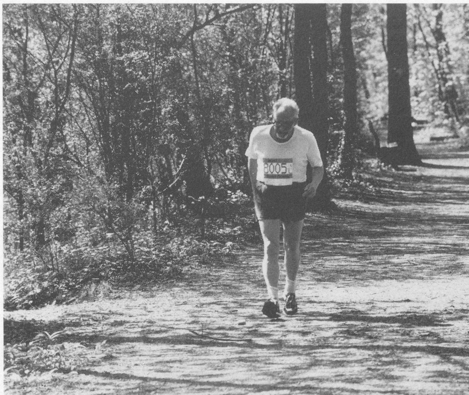
Am Basler Geländelauf nahm dieser 86jährige Senior teil. Er legte 10,6 km in 1,5 Stunden zurück. Zu dieser glanzvollen Leistung gratulieren wir herzlich.