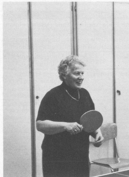
Tischtennis, das jüngste Angebot des Seniorensports, erfreut sich immer grosserer Beliebtheit.