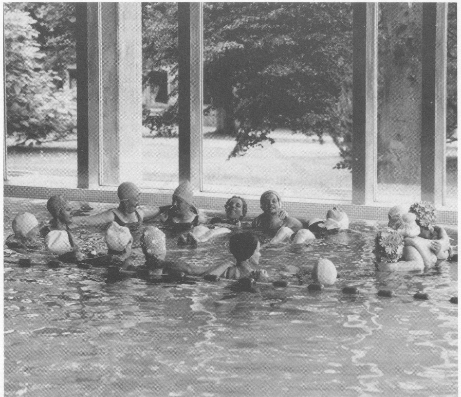
Wassergymnastik im Kurzentrum Rheinfelden erfreut sich grosser Beliebtheit.

Voranzeige: Im Januar/Februar 1988 beginnt wieder ein Rückenschwimmkurs. Weiteres im nächsten AKZENT.