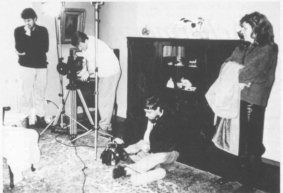
Die Fernsehcrew bei den Dreharbeiten für den «Treffpunkt»-Beitrag über die Pro Senectute Basel