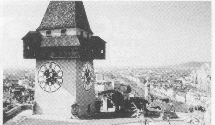
Graz – Hauptstadt der Steiermark.