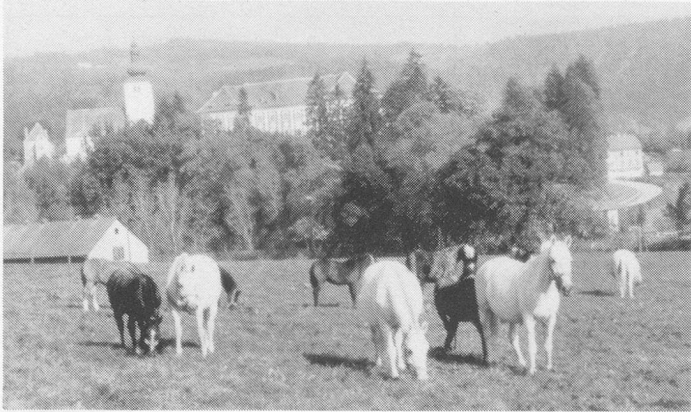
Lippizaner-Gestüt in Piber.