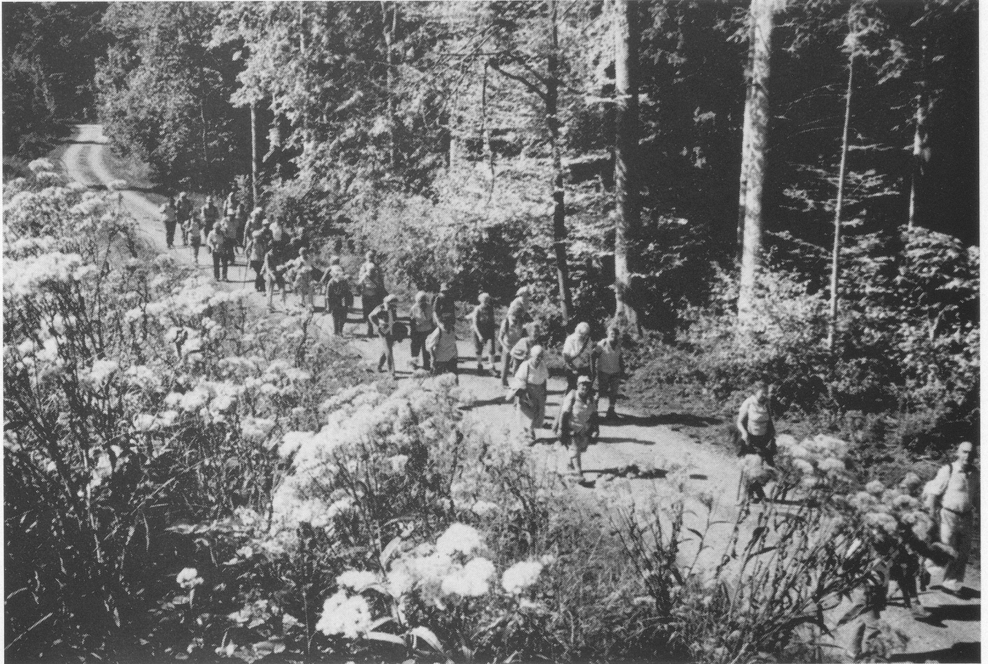
Durch Feld und Wald...