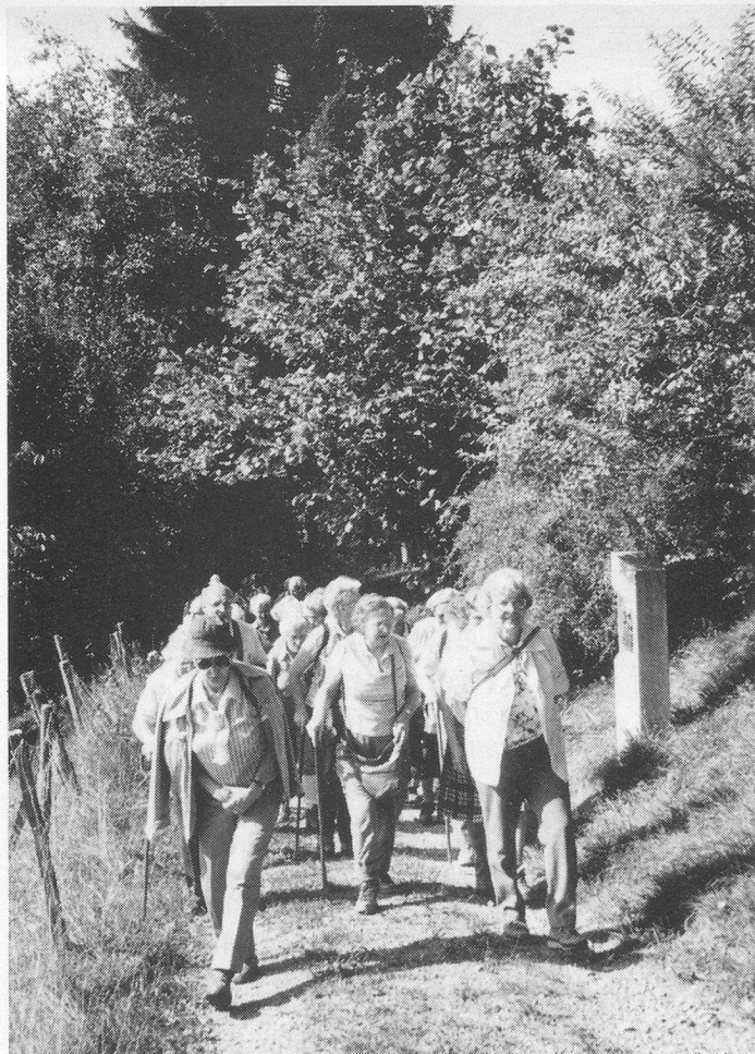
Hinauf in die höchsten Höhen.