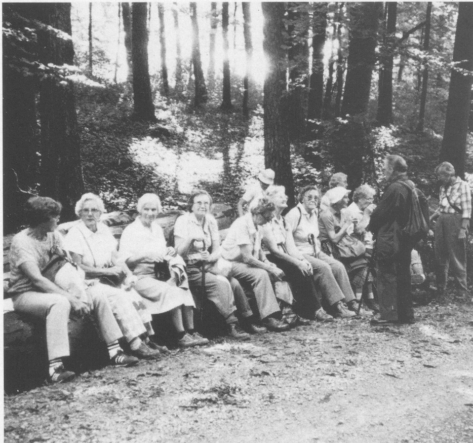
Auch eine Ruhepause gehört zum gesunden Wandern.