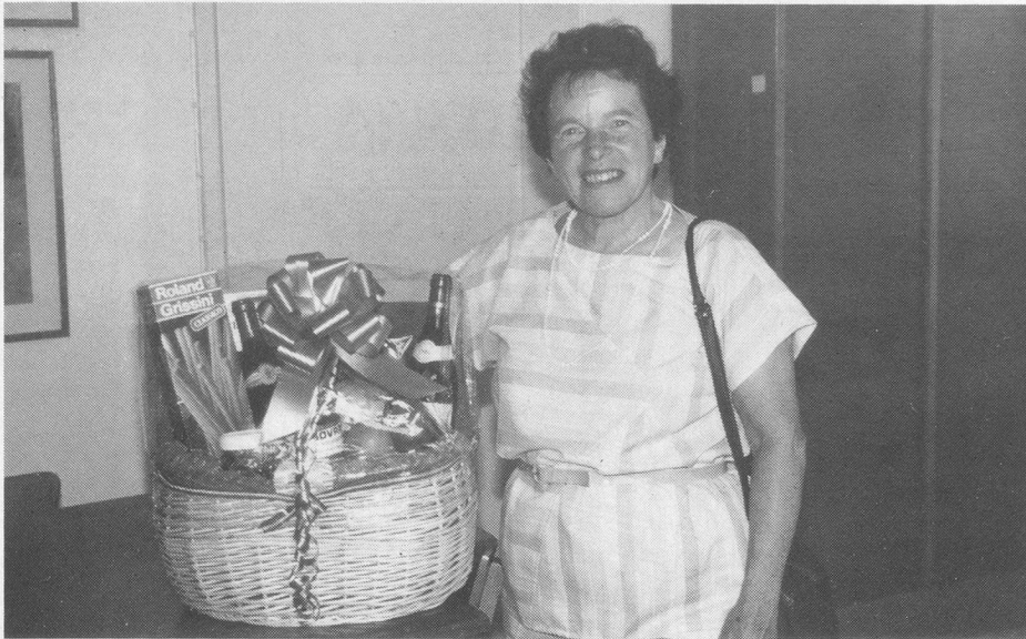
Gross war die Freude über die prächtigen Fruchtkörbe.