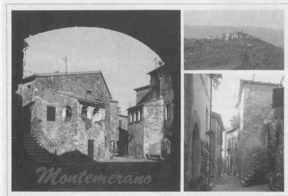
Die typisch idyllischen Gässchen der Toskana.

Unser Standort ist Montemerano , ein reizendes Hügelstädtchen in der Südtoskana, abseits des Touristenstroms. Dort logieren wir in gut eingerichteten Wohnungen (1–2 Personen).