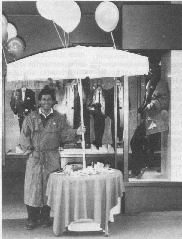
Einer unserer Informationsstände am Sammeltag in der Freien Strasse.