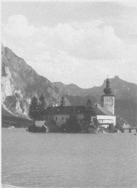
Schloss Ort in Gmunden am Traunsee