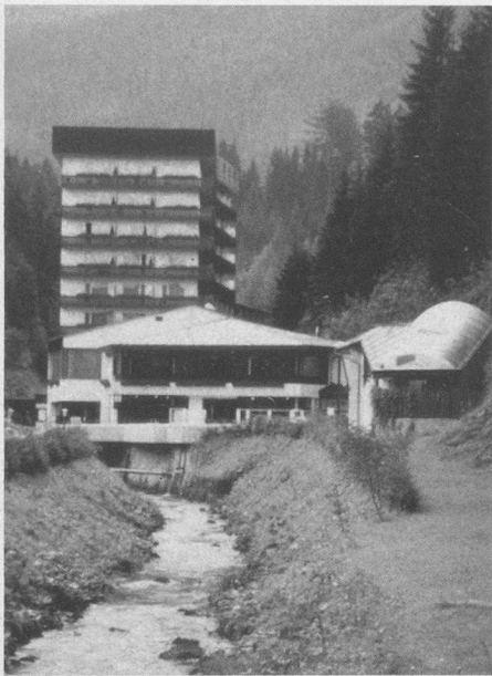
Hotel Heilbrunn in Bad Mitterndorf