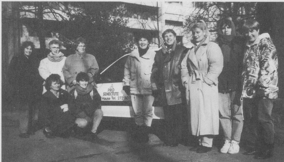
Das Team der Mahlzeitenverträgerinnen von Pro Senectute Basel-Stadt.

Morgens früh um sieben Uhr werden die Autos beladen, und dann geht es los: von Strasse zu Strasse, von Haus zu Haus. Wir