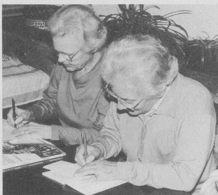
Gemeinsam lernen macht uns Freude.

Interessentinnen und Interessenten melden sich bitte unter: Telefon 272 30 71 (08.00 – 11.30 Uhr)