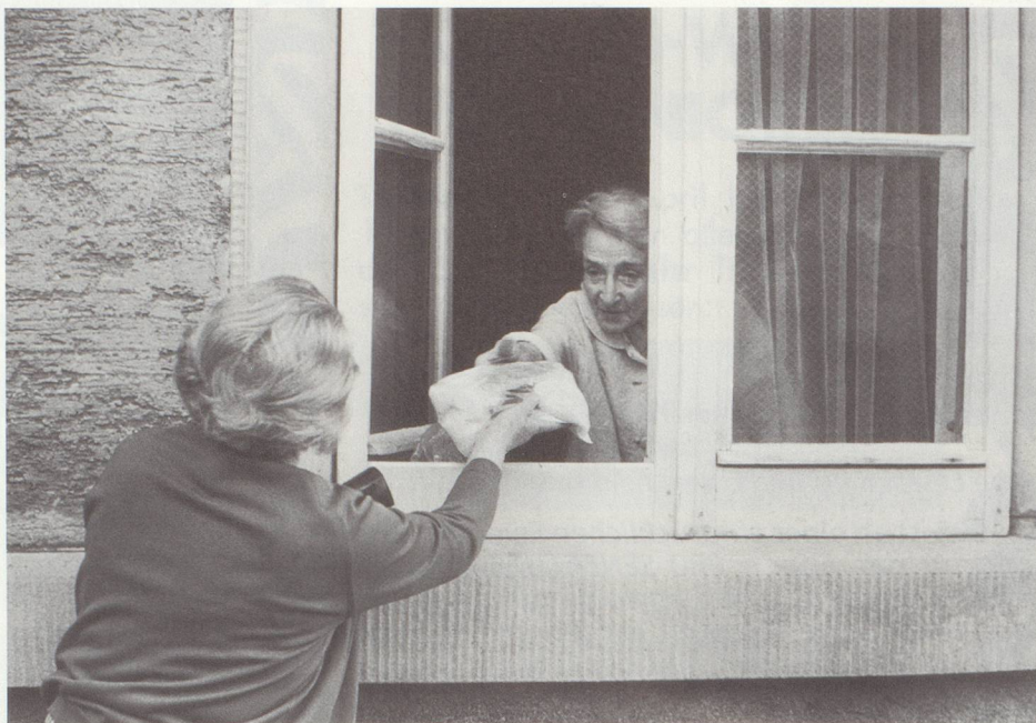
Das Überbringen von Mahlzeiten und ein paar freundschaftliche Worte – Alltag für unsere Verträgerinnen