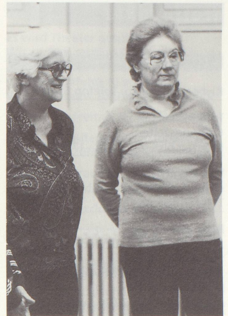
Bewegung und Gemeinschaft – auch zuzuschauen gehört dazu