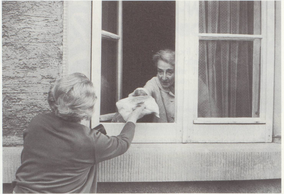
Das Überbringen von Mahlzeiten und ein paar freundschaftliche Worte – Alltag für unsere Verträgerinnen