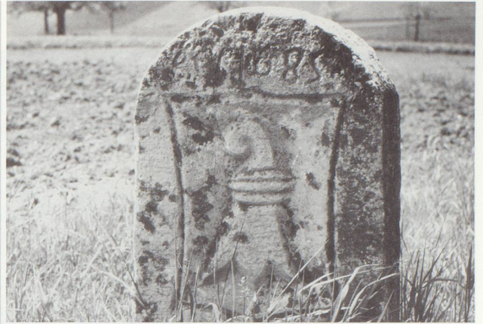
▲ Grenzstein im Baselbiet – Maisprach