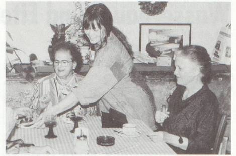
Mittagstisch im Seniorentreffpunkt Kaserne

Angebote: Kurse, Jassen, Schach, Tanzabende, Konzerte usw. Programme können im Alterszentrum bezogen werden.