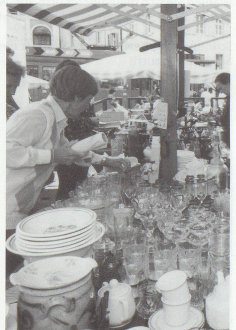
Schnaigge am Flohmarkt.