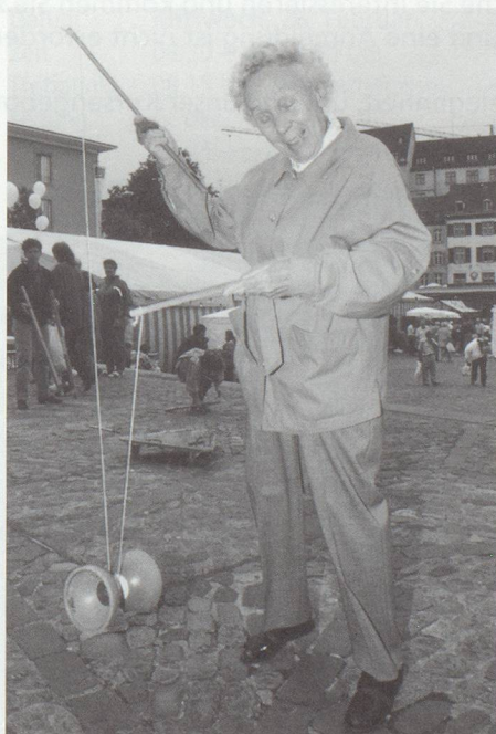
... und alt.