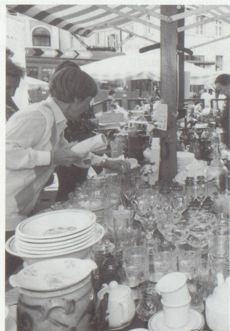
Schnaigge am Flohmarkt.