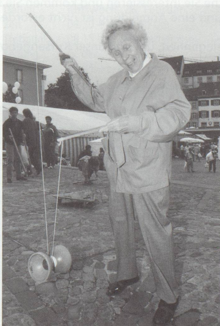
... und alt.