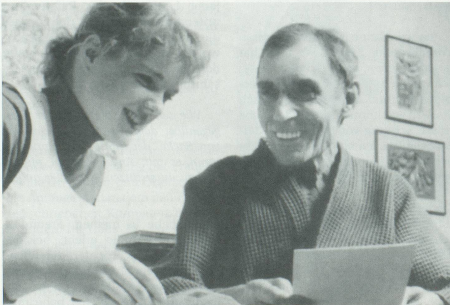
Nach wie vor ist die Pflege alter Menschen Frauensache

Also ohne falsche Komplimente, aber das machen Sie. Allein, wenn ich Ihr vielfältiges Kursangebot anschau. Sie bieten, ich sage es jetzt ein wenig abschätzig, nicht einfach Freizeitbeschäftigung an, sondern zum Teil sehr anspruchsvolle Kurse. Menschen, die auch im Alter ihre Interessen pflegen, sind nämlich wirklich spannende und aktive Gesprächspartner. Deshalb kann die Aufgabe von Pro Senectute nicht hoch genug geschätzt werden. Sie nehmen die Leute ernst, indem Sie ihnen vielleicht auch etwas abfordern.