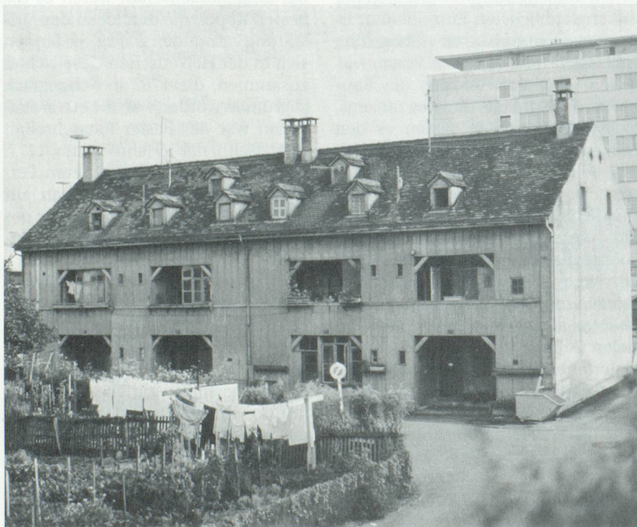
Arbeiterwohnungen «In der Breite»

Die 1844 entstandene «Kommission für Fabrikarbeiterverhältnisse» setzte sich für billige und gesunde Wohnverhältnisse ein. Tatsächlich waren die Wohnverhältnisse der Arbeiterschaft trist. Die verlotterten Hinterhäuser waren oft Seuchenherde. Cholera- und Typhusepidemien waren nicht selten. Die GGG gründete eine Aktiengesellschaft, die in der Breite Bauland kaufte, wo sie drei Gebäudekomplexe erstellte. Es entstanden Wohnungen, die «zu den niedrigsten Miethpreisen auch dem ärmsten Arbeiter noch eine gesunde, freundliche und wohnliche Stätte» ermöglichten. 1869 gründete die GGG die «Baugesellschaft zur Erstellung von Arbeiterwohnungen». In den nächsten Jahren entstanden 86 neue Häuser mit günstigen Wohnungen im Bachlettenquartier, am Bläsiring und an der Klybeckstrasse.