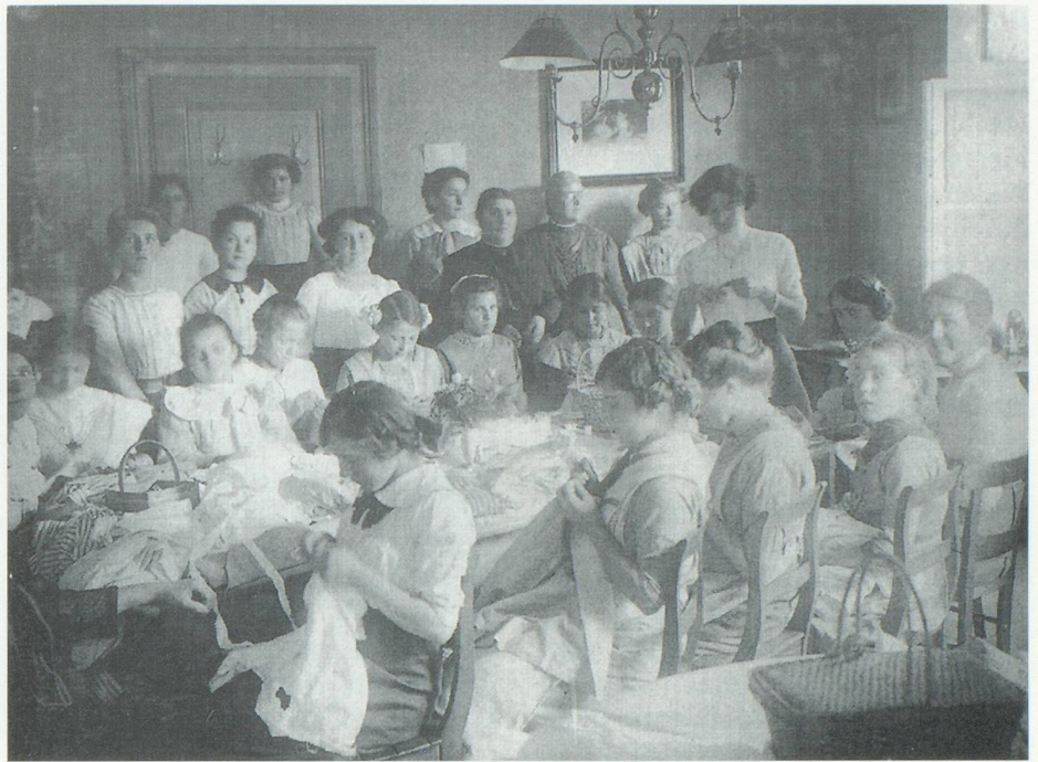
Nähstunde für Dienstmägde

Nicht dass Basel eine Ausnahme gewesen wäre. Im benachbarten Frankreich, mit seinen unerträglichen inneren Ungerechtigkeiten, der Erstarrung der staatlichen und sozialen Einrichtungen und dem moralischen Niedergang der herrschenden Schichten, kündigte sich die grosse Revolution an. In der Eidgenossenschaft und auch in Basel waren die Verhältnisse etwas