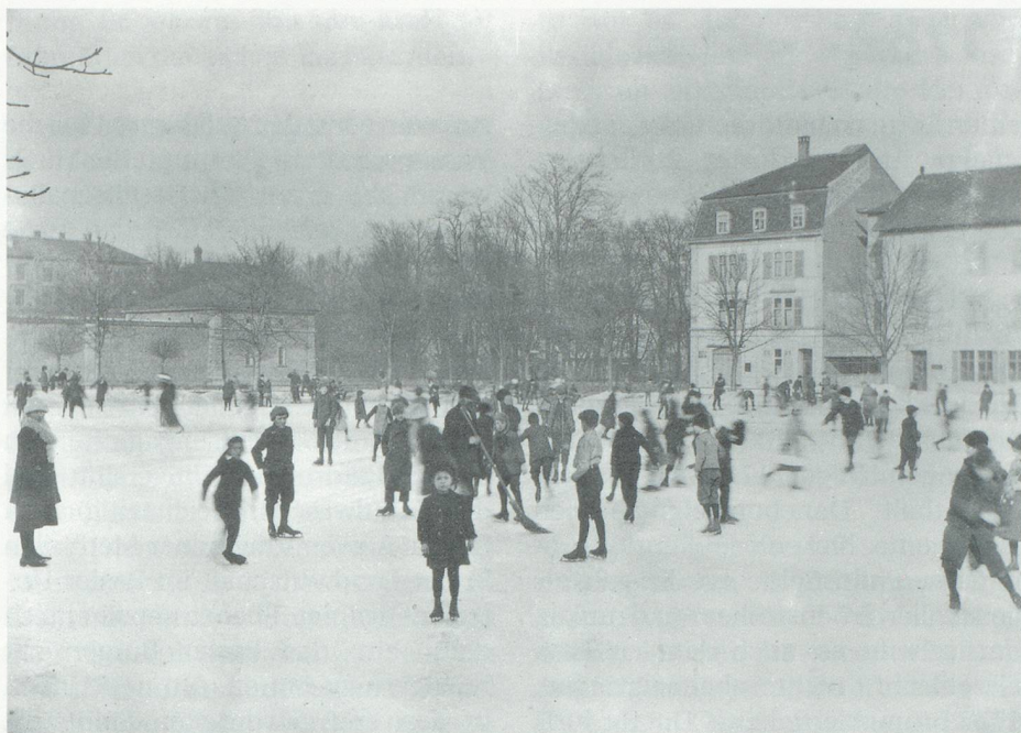
Schlittschuhlaufen auf dem Schellenmätteli

– bereits seit 1809 – liess man seit 1860 «unbemittelte Knaben» Violinunterricht nehmen und gründete eine Chorschule für junge Leute. Auch die Musikschule, gegründet 1867, ist ein Kind der GGG. Ab 1900 veranstaltete die GGG Volkskonzerte mit ernster Musik, um das musikalische Verständnis in der Bevölkerung zu fördern.