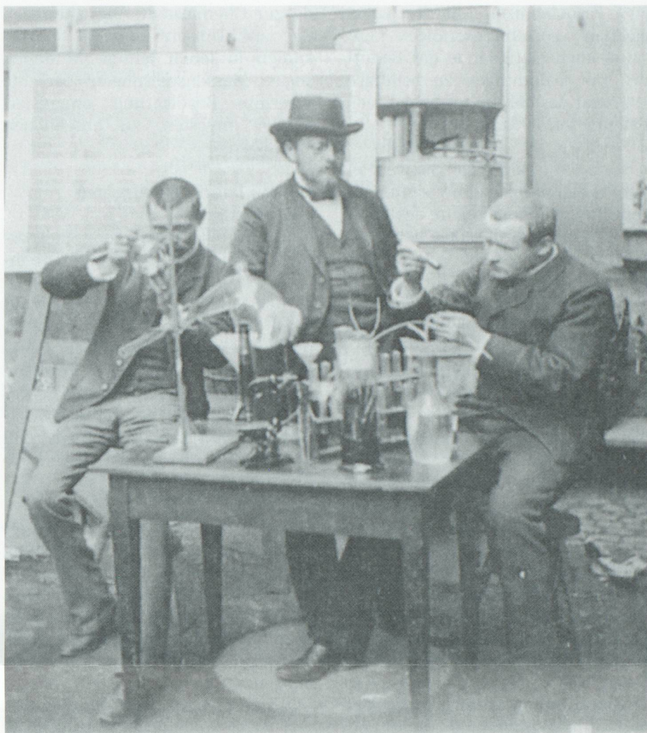
Chemiker um 1890