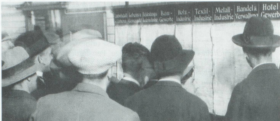
Anschlagbrett für Stellensuchende