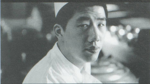
Solang' mein Essen schmeckt.»