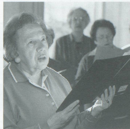
Singgruppe bei Pro Senectute Basel-Stadt

Wir tun viel und wir tun es gern! heisst unser Motto. Einige Zahlen aus dem vergangenen Jahr mögen das belegen: