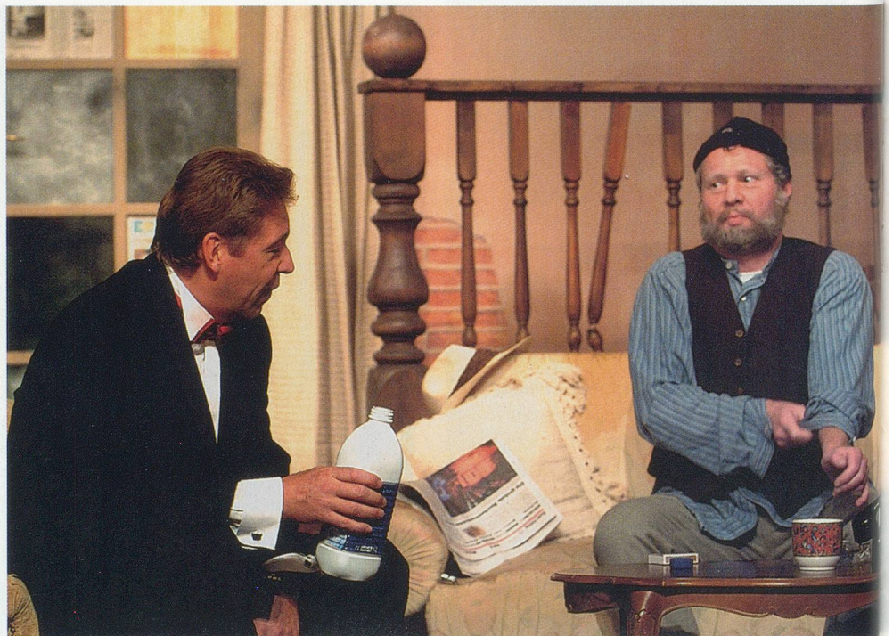
«Grille und Ameise»

Man kann ja nicht, wenn wir Baseldeutsch sprechen, die Geschichte irgendwo in Lappland spielen lassen. Das funktioniert nicht. Der Dialekt ist immer ortsgebunden. Das ist meine persönliche Auffassung und danach versuchte ich mich zu richten. Gerade im aktuellen