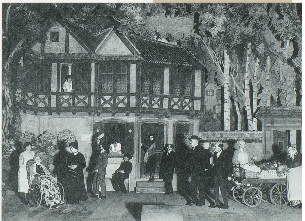
«Unerdem glyche Dach» 1927/1943

1892 wurde die Dramatische Gesellschaft Basel gegründet. Mit einer Ausnahme wurden bis 1925 ausschliesslich schriftdeutsche Stücke gespielt. 1925 erfolgte die Gründung der Dialektgruppe «Baseldytschi Bihni». In den Anfangszeiten hatte die «Baseldytschi Bihni» keine feste Bleibe. Sie musste die Probe- und Aufführungsorte immer wieder wechseln. Daneben ging sie auf Tournee durch verschiedene Schweizer Städte. Während dem 2. Weltkrieg spielte sie an der Front und gab sich 1942 den Zusatztitel «Basler Heimatschutz-Theater», den sie noch immer in ihrem Namen führt. Ein Meilenstein stellte 1962 der Bezug des eigenen Theaterkellers an der Leonhardsstrasse 7 dar. Dort spielte die «Baseldytschi Bihni» bis 1995, als sie der baselstädtischen Schulreform weichen musste. Sie hatte aber sehr viel Glück im Unglück und fand im Lohnhof eine neue Bleibe, wo sie seit 1996 spielt.