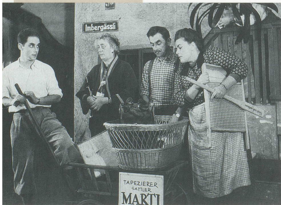
«Imbergässli 7» 1947

Ort Basler Marionettentheater, Münsterplatz Daten 13. / 19. / 20. und 21. März