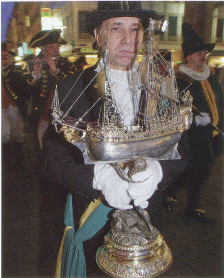
Das Schiff der E. Zunft zu Safran

lieren. Mag sein, dass damals, anders als heute, die Zugehörigkeit zu einer Gesellschaft mehr als Pflicht, denn als Ehre empfunden wurde. Gleichzeitig musste ein Handwerker, wollte er seinen Beruf ausüben, Mitglied einer Zunft sein.