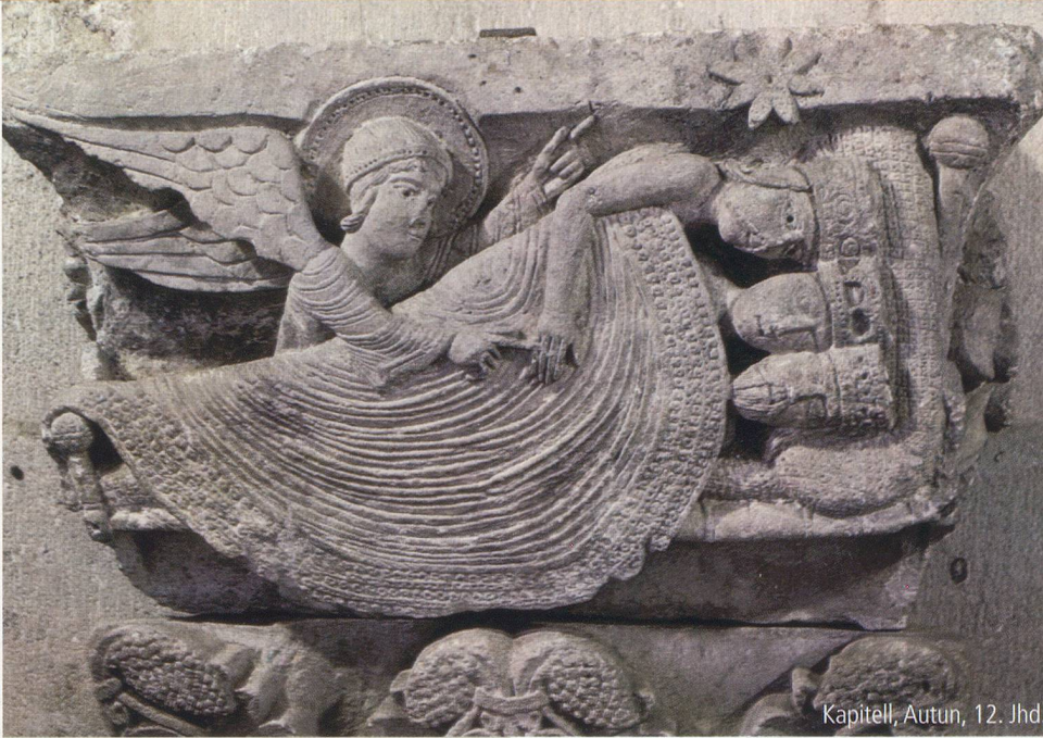
Kapitell, Autun, 12. Jhd.