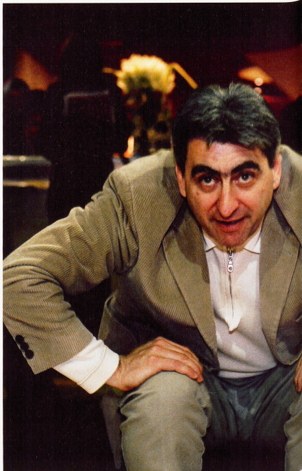
Bildlegende Oben: Nicolas Hayek an der Baselworld 2003 Rechts unten: Art Unlimited, Basel 2007 Seite 16: Baselworld 2003, Eingangsbereich

Adam Smith (1723-1790) – dessen Grundüberlegungen die Basis für den Wirtschaftsliberalismus bildeten – hatte zur Frage der staatlichen Wirtschaftsförderung eine klare Meinung. In seinem Hauptwerk «Der Wohlstand der Nationen» schrieb der Begründer der modernen Nationalökonomie, dass es eine Staatsaufgabe sei, «öffentlichen Anlagen und Einrich-